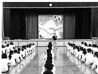
縦の通りは美しい！2学期は横も頑張ろう！